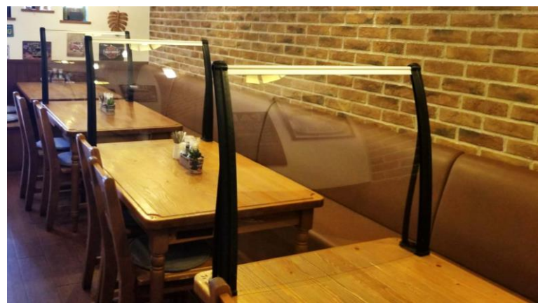
守られている安心感 クリアボード