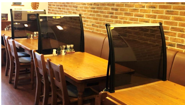
個室感覚 ブラウンボード